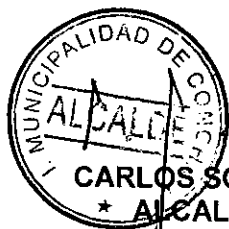
CARLOS SOTTOLICHIO URQUIZA * ALCALDE DE CONCHALÍ