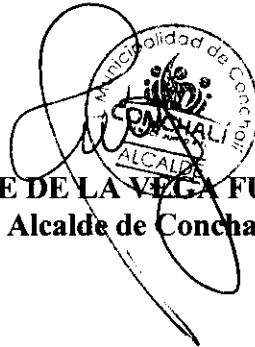
RENE DE LA VEGA FUENTES Alcalde de Conchalí