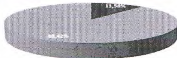
■ Subvención Municipal ■ Remuneraciones Totales