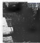
Los Alcañes, esquina La Conchalí

El presupuesto disponible financiado por el Gobierno Regional Región Metropolitana corresponde a $1.316.352.000.- IVA Incluido.