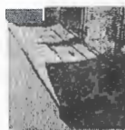
Los Magreles, esquina Apala

Lo anterior, de acuerdo a Bases Administrativas, Bases Técnicas, Formatos, Consultas en Foro Inverso anexos publicados y la oferta del proponente.