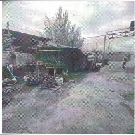
Construcción no declarada en planimetría, se encuentra adosada a muro medianero y en condiciones no óptimas.