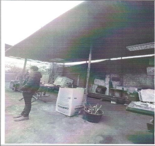
Cobertizo ubicado en patio del predio, concordante con planimetría.