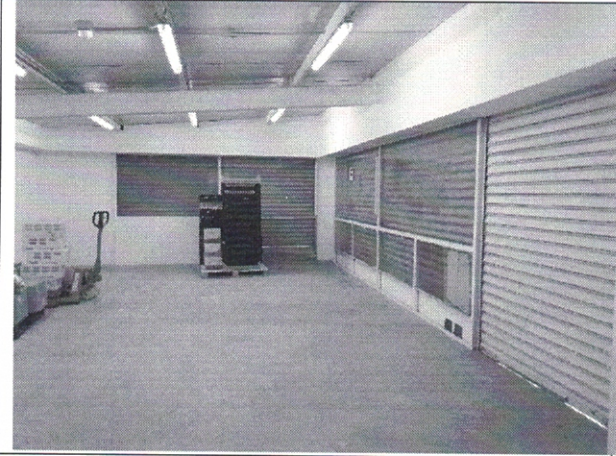
Imagen Local, USADO COMO BODEGA