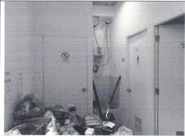
Imagen de Bodega 2