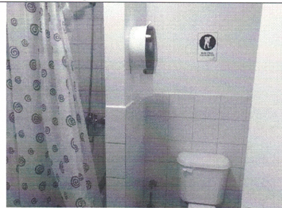
Imagen de Baño Personal N° 2