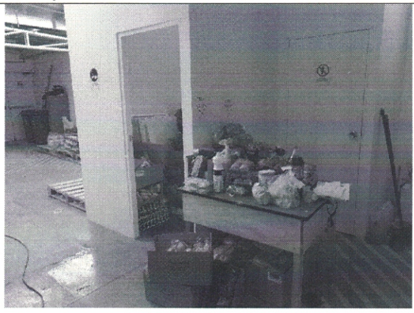
Imagen de Bodega 1