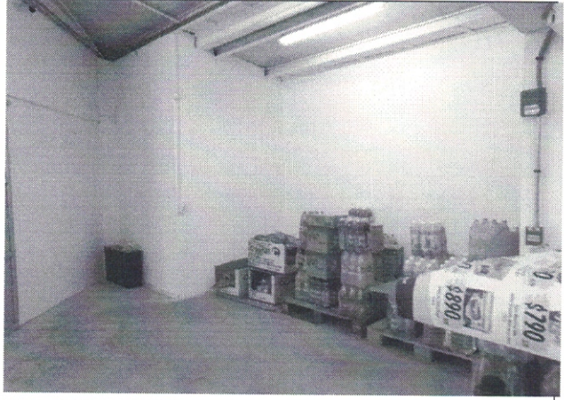
Imagen de ubicación de baños de clientes, USADO COMO BODEGA