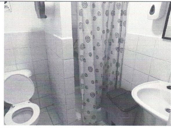
Imagen de Baño Personal N° 1