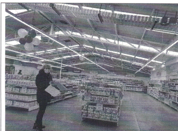
Imagen De Interior De Local Comercial