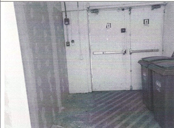
Ubicación de red húmeda, NO EXISTENTE