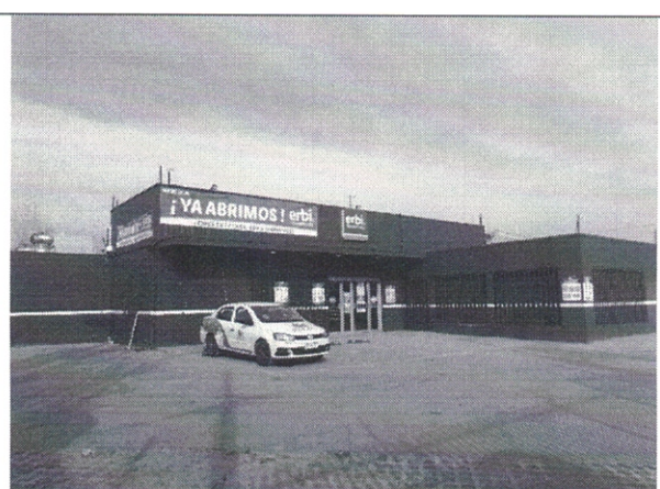
Imagen de estacionamiento, Estacionamientos no demarcados.