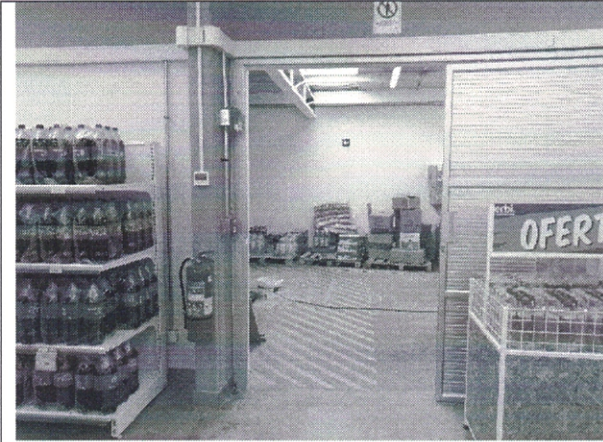
Imagen de Entrada a bodegas y Baño de Personal