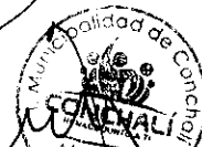
RENE DE LA VEGA FUENTES ALCALDE DE CONCHALÍ