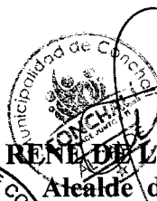
RENE DE LA VEGA FUENTES Alcalde de Conchalí