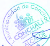
RENE DE LA VEGA FUENTES Alcalde de Conchalí