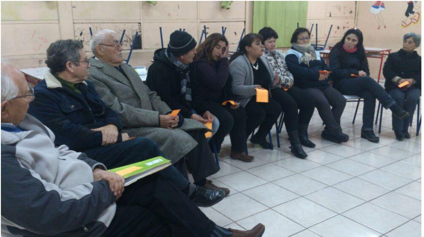
FOTO N° 6: REUNIÓN BARRIO "EL CORTIJO" 25 DE AGOSTO DE 2015, LICEO "FEDERICO GARCÍA LORCA"