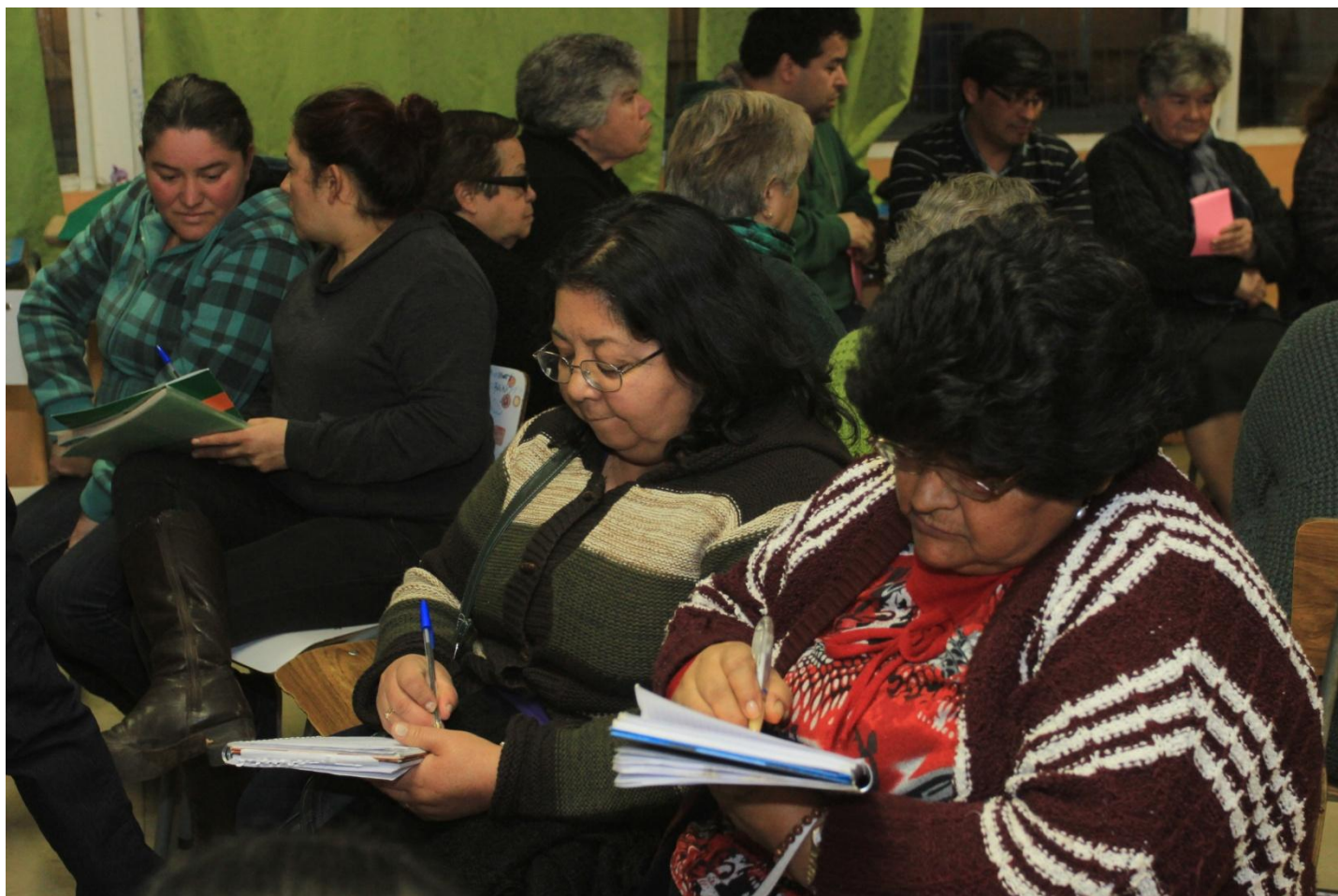
FOTO N° 1: REUNIÓN CONJUNTA DE LOS BARRIOS VESPUCIO-ORIENTE Y BALNEARIO 24 DE AGOSTO DE 2015, ESCUELA "ARAUCARIAS DE CHILE".