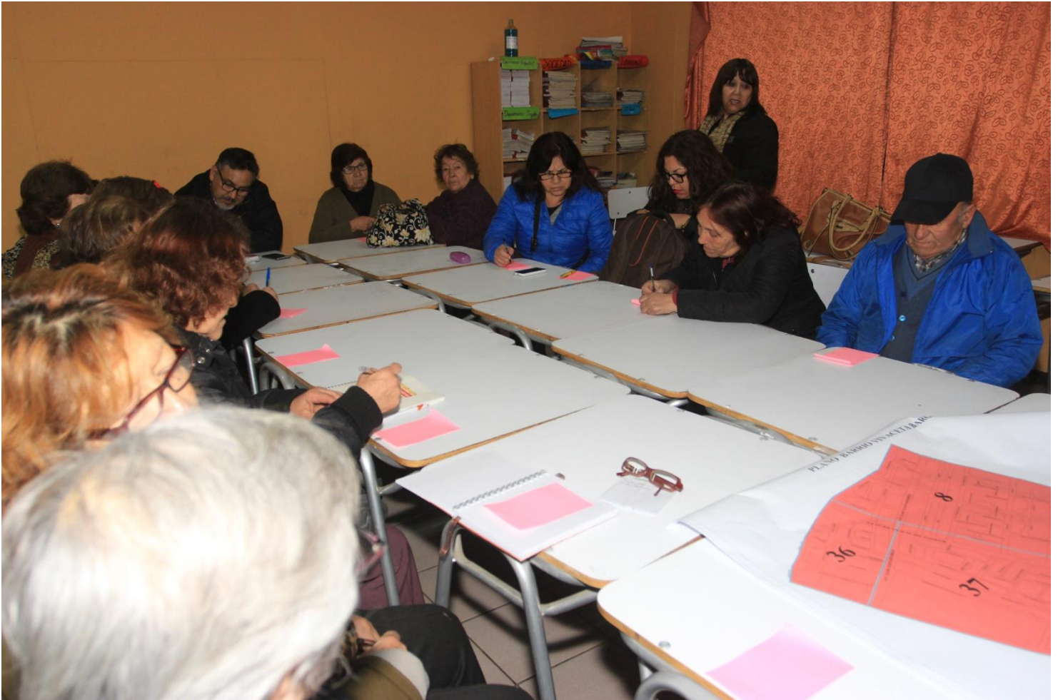
FOTO Nº 3: REUNIÓN BARRIO VIVACETA-BARÓN 27 DE AGOSTO DE 2015, ESCUELA "PEDRO AGUIRRE CERDA".