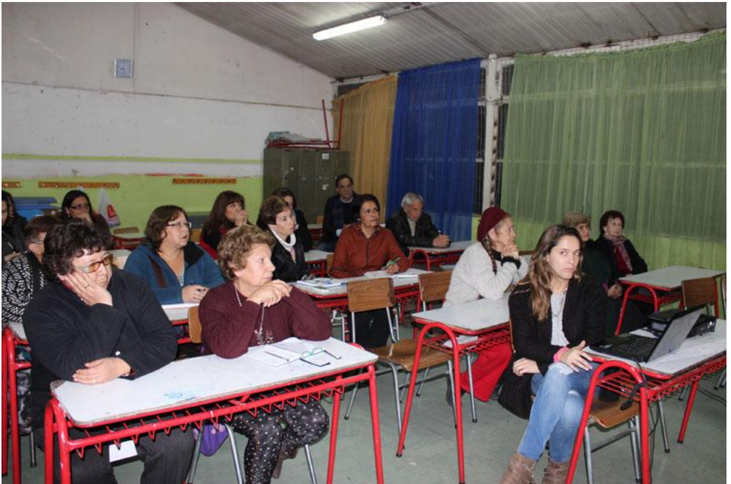
FOTO Nº 4: REUNIÓN BARRIO SUR 26 DE AGOSTO DE 2015, ESCUELA "VALLE DEL INCA"