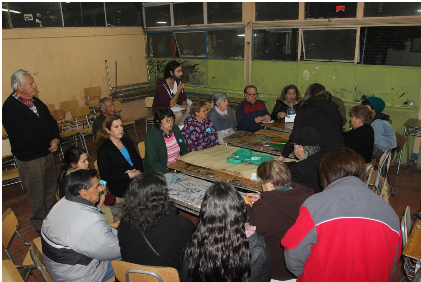
FOTO N° 2: REUNIÓN BARRIO JUANITA AGUIRRE 26 DE AGOSTO DE 2015, LICEO "ALMIRANTE RIVEROS".